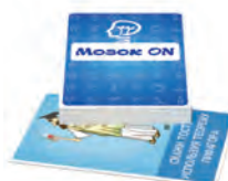
Мозок ON Завдання цієї колоди для тих, хто ще може щось второпати