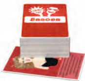
Базова Основна колода гри