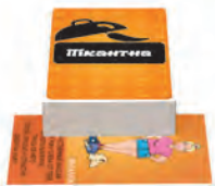
Пікантна Додасть легкі нотки вишуканості та еротики вечірці