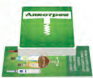
Алкотреш Завдання для алкопати із ацентом на "алко"