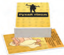
Рухай тілом Завдання цієї колоди змусять тебе підвестись з-за столу і як слід поворушити сідничками