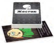
Жестяк Круті завдання для відпочинку, що зносять дах